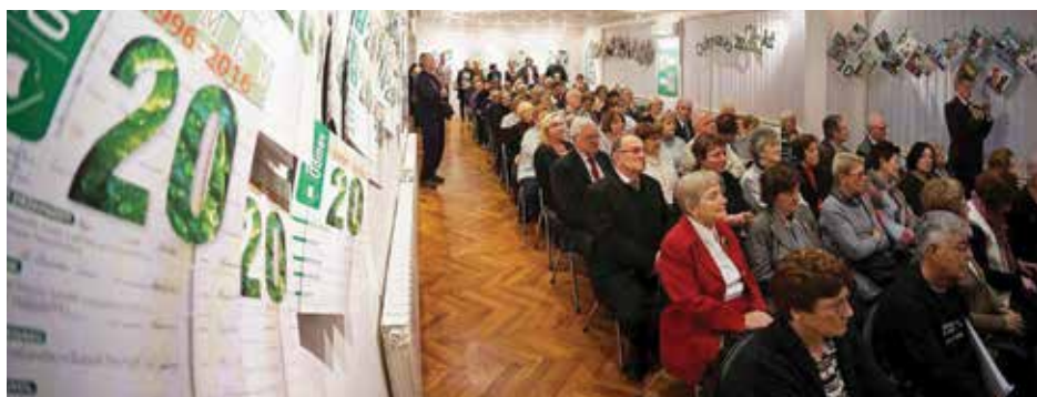
Izid 60. številke Novega odmeva in razstava o zgodovini društvenega glasila, leta 2016.