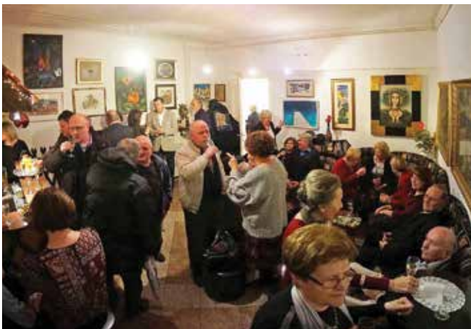
Članom največ pomeni, da se v društvu lahko pogovarjajo „po domače“, v slovenščini.