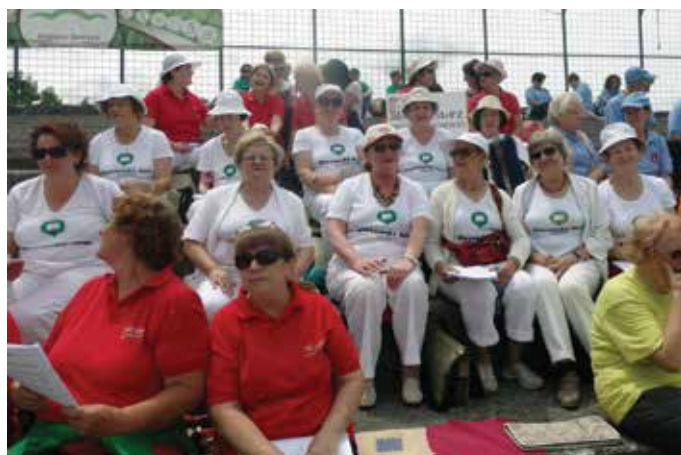
Zbor ni zamudil nobenega pevskega tabora v Šentvidu pri Stični.