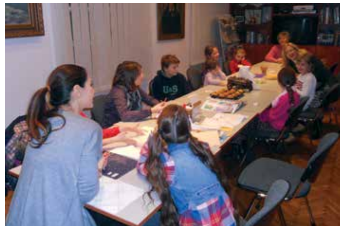
Največje veselje je, ko se v Slovenskem domu razlega smeh najmlajšega rodu zagrebških Slovencev. Na sliki otorska delavnica leta 2014.