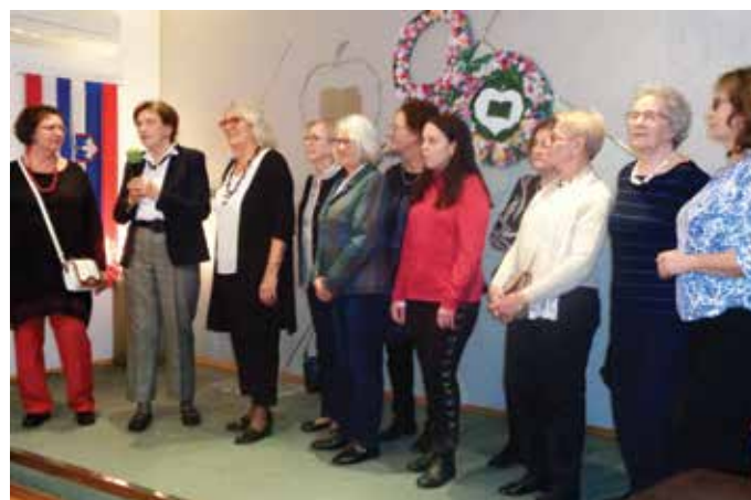
Članice kreativne delavnice vsako leto presenetijo s kakšno novostjo.