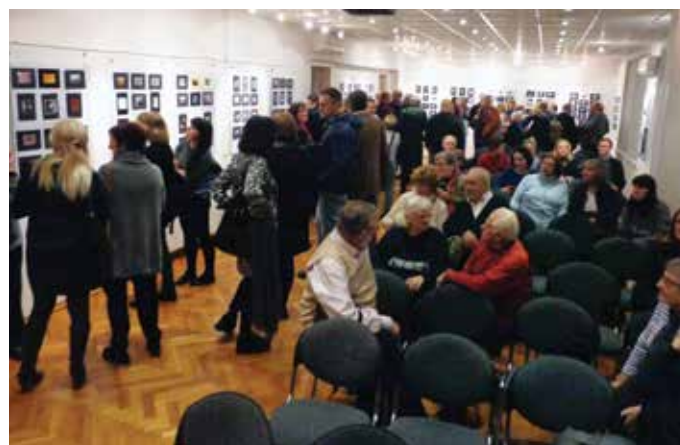
Izkupiček sedmega salona miniatur leta 2017 je bil namenjen otrokom z razvojnimi težavami in invalidnostjo.