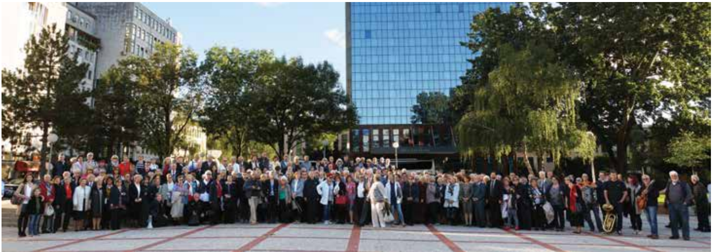
Rojaki na 25. obletnici Zveze slovenskih društev na Hrvaškem in na 11. Vseslovenskem srečanju v Zagrebu, leta 2017.