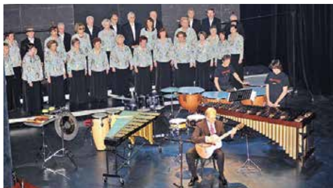
80. obletnica Slovenskega doma v dramskem gledališču Gavella, leta 2009.