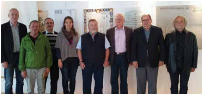
Člani Slomaka, leta 2015.