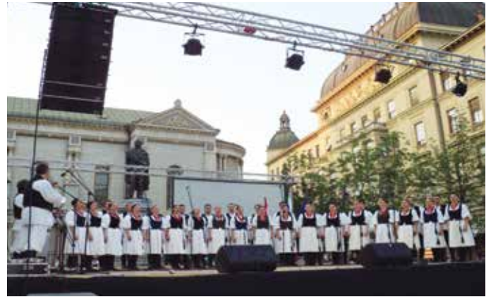
Koncert na Cvetnem trgu, darilo slovenske skupnosti Zagrebčanom ob vstopu Hrvaške v EU leta 2013.

Hrvaška država z različnimi mehanizmi sofinancira delovanje društva in slovenske manjšine v celoti.