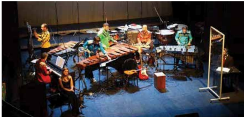
Sudar Percussion na slovesnosti ob 85. obletnici Slovenskega doma v dramskem gledališču Gavella.

Dobro desetletje so bili zaščitni znak Slovenskega doma – harmonikarji. Med letoma 1977 in 1987 je orkester pod vodstvom Zvonka Šiljca nastopal na prireditvah v društvu ter številnih zagrebških in hrvaških odrih. Prejeli so številna priznanja, domača in mednarodna, denimo srebrno plaketo na fe-