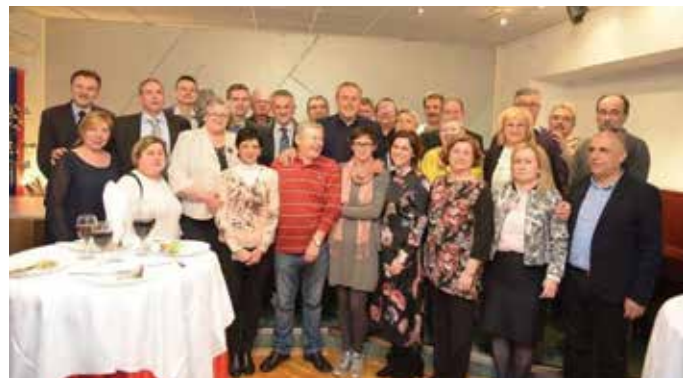
Druženje z zagrebškim županom Milanom Bandićem in s predsedniki vseh manjšinskih svetov in predstavniki ter tajniki nacionalnih manjšin Mesta Zagreb v Slovenskem domu, leta 2018.

Slovenci so z novo hrvaško ustavo leta 1990 dobili položaj manjšine; v temeljnih načelih je pisalo, da je Republika Hrvaška država hrvaškega naroda in pripadnikov narodnih manjšin, med katerimi so bili Slovenci izrecno navedeni. Leta 1997 je prišlo do bolečega izbrisa, ki ga je slovenska skupnost doživela kot simbolni izraz nespoštovanja narodnostnega dostojanstva, čeprav tega v vsakdanjem življenju ni občutila. Leta 2010 je Hrvaški sabor popravil krivico z naslednjim zapisom v preambuli ustave: »Republika Hrvaška je ustanovljena kot nacionalna država hrvaškega naroda in pripadnikov narodnih manjšin: