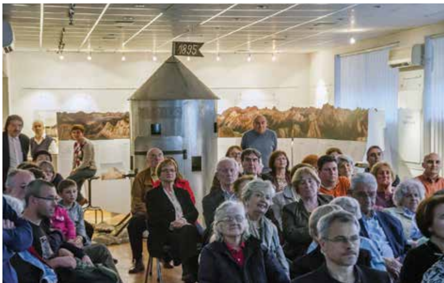
Razstava z Aljaževim stolpom v Slovenskem domu, leta 2016..