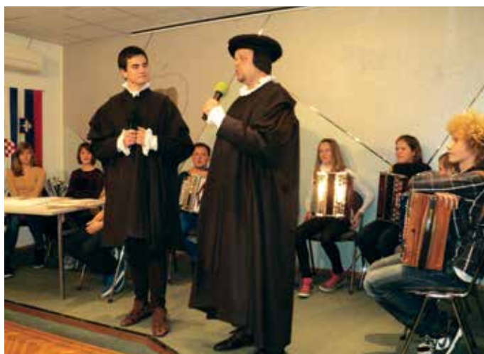
Kulturni program ob dnevu reformacije, leta 2013.