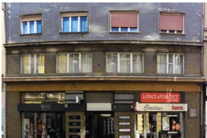
Slovenski dom na Masarykovi 13 v Zagrebu.

NAKIČ ni bilo edino slovensko društvo, ki je delovalo v Zagrebu v času prve Jugoslavije, pa vendar se je vanj že v prvem letu včlanilo prek tisoč ljudi. Prvi povojni podatek je iz leta 1946, ko je bilo evidentiranih 1361 članov, leta 1950 jih je bilo že 2232. Postopno je članstvo usihalo. V letu 1989 je bilo le še »120 aktivnih članov«. V 90. letih je število članov spet naraščalo, se v novem tisočletju ustalilo, v zadnjem obdobju pa spet zmanjšalo in leta 2019 ustavilo pri številki 500. Popisi prebivalstva kažejo, da se slovenska skupnost ne le krči, ampak tudi stara (povprečen Slovenec na Hrvaškem je star 59,7 leta), nove generacije se ne opredeljujejo kot Slovenci, dosedanje oblike združevanja jih ne pritegnejo. Ob razpadu Jugoslavije je na Hrvaškem živelo nekaj manj kot 24 tisoč Slovencev, leta 2001 še dobrih 13 tisoč, ob zadnjem popisu leta 2011 pa natanko 10.517.