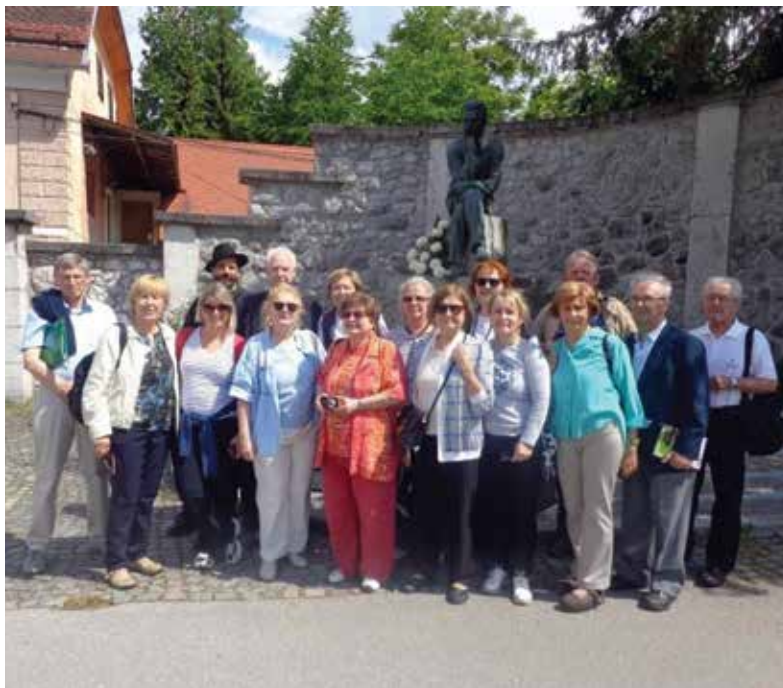
S študijskega potovanja na Vrhniko – pri Cankarjevem spomeniku leta 2018.