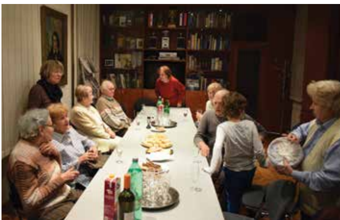
Knjižnica in čitalnica Slovenskega doma je primerna tudi za druženje.

Društvo je delovalo na vseh koncih Zagreba in se kar naprej selilo, prostore so prodali ali so bili oddani drugim, včasih so selitvam botrovala politične razmere. NAKIČ je prvih pet let deloval v Gundulićevi ulici 29, naslednja tri leta v Ulici kraljice Marije (v današnji Hebrangovi ulici), naslednja postaja je bila Berislavićeva ulica 11, a le za dve leti. Že leta 1940 je bila spet potrebna selitev, tokrat na Tomislavov trg 19. Ko je tam med vojno delovalo zavetišče za begunske otroke, je bil sedež društva v Berislavićevi ulici 6. Po vojni je Slovenski dom v uporabo dobil hišo v Trenkovi ulici 9. Zadnja selitev je potekala pred okroglimi 70 leti. Takrat se je društvo ustalilo v Masarykovi ulici 13. Po razpadu nekdanje skupne države je bila usoda prostorov dalj časa negotova. V obdobju čakanja je bila leta 1994 izvedena celovita prenova, kasneje še enkrat leta 2003. Po končanem postopku denacionalizacije so prostori pripadli Mestu Zagrebu in pozneje hrvaški vladi, društvo pa je še naprej najemnik. Vse zamisli, da bi jih odkupili, so se iz-