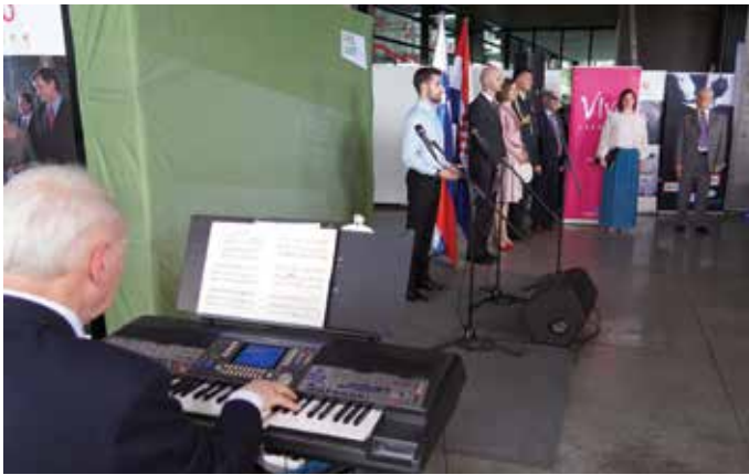
Dan državnosti v zagrebškem Muzeju sodobne umetnosti, leta 2019.