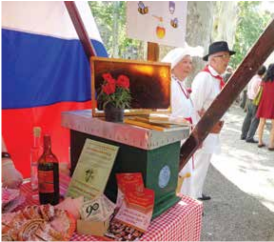
Slovenska stojnica na Zrinjevcu na dnevu zagrebških narodnih manjšin, leta 2019.