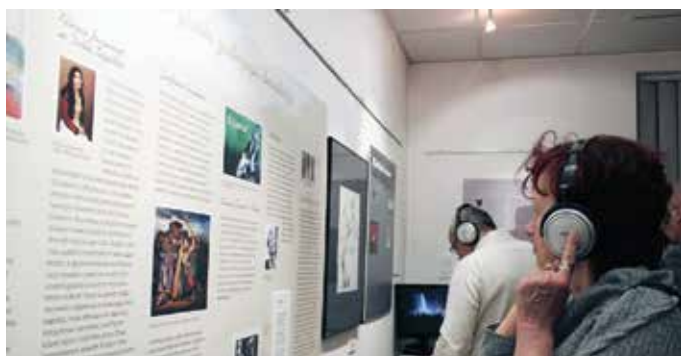
Zvočna razstava o Prešernu v popularni glasbi, leta 2018.