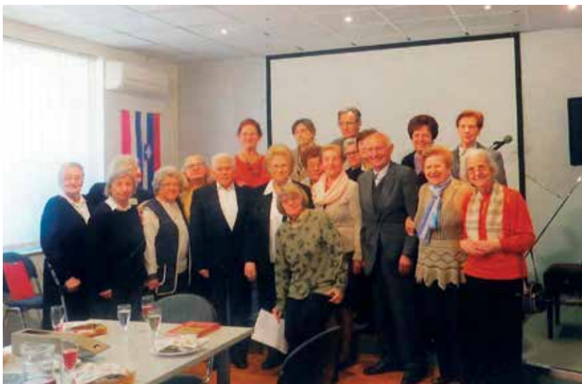
Z občnega zbora izgnancev leta 2017.