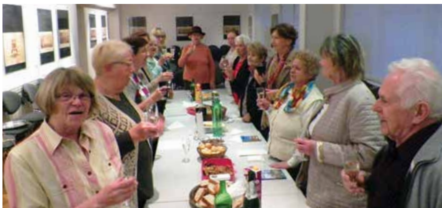
Na petkovih srečanjih je vedno veselo.