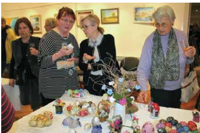
Šopkove razstave so od leta 2006 nepogrešljiv uvod v velikonočno praznovanje.