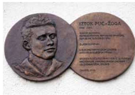
Spominske plošče dramskemu umetniku Hinku Nučiču, opernemu pevcu Josipu Gostiču in rokometašu Iztoku Pucu.