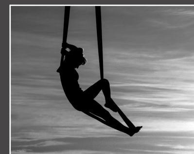
Gordana Uroić, Spremna za ples