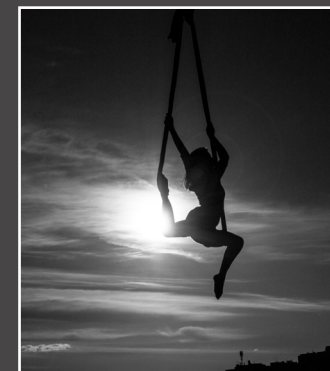
Gordana Uroić, Ples na svili