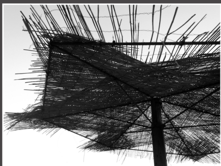
Ljubica Babac, Girasole modificato , 3. nagrada

Još jedna nova izložba, u ovoj po mnogo čemu dramatičnoj i neizvjesnoj godini, Jugledat će svjetlo dana usprkos svim nedaćama koje su zadesile Fotoklub Zagreb. I dok se u Klubu intenzivno radi na obnovi potresom oštećenih prostorija, članovi marljivo rade na realizaciji svih izložbi koje su planirane za ovu godinu. Još nemamo vlastiti uređeni prostor ali imamo zato prijatelje koji nam otvaraju svoje galerije. Tako će se zahvaljujući prijateljima iz Slovenskog doma, tradicionalna izložba „Kolekcija godine 2020.“ otvoriti u njihovoj galeriji. Veliko im hvala na pruženom gostoprimstvu.