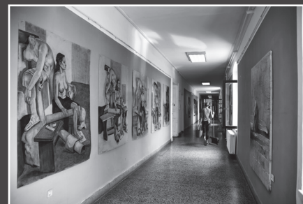
Neda Rački, Ars longa vita brevis 4, 1. nagrada