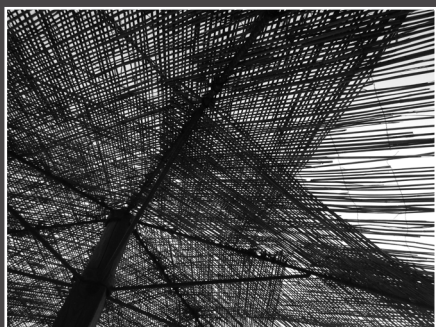
Ljubica Babac, Girasole Decostruzione , 3. nagrada