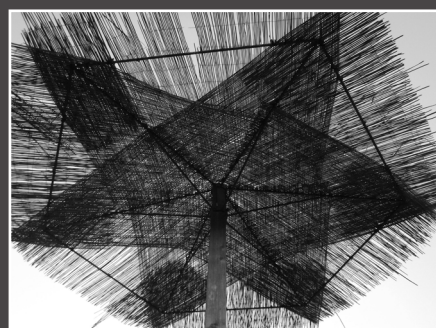
Ljubica Babac, Girasole e ancora in piedi , 3. nagrada