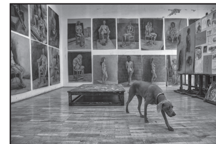
Neda Rački, Ars longa vita brevis 3, 1. nagrada

Izložba fotografija članova Fotokluba Zagreb