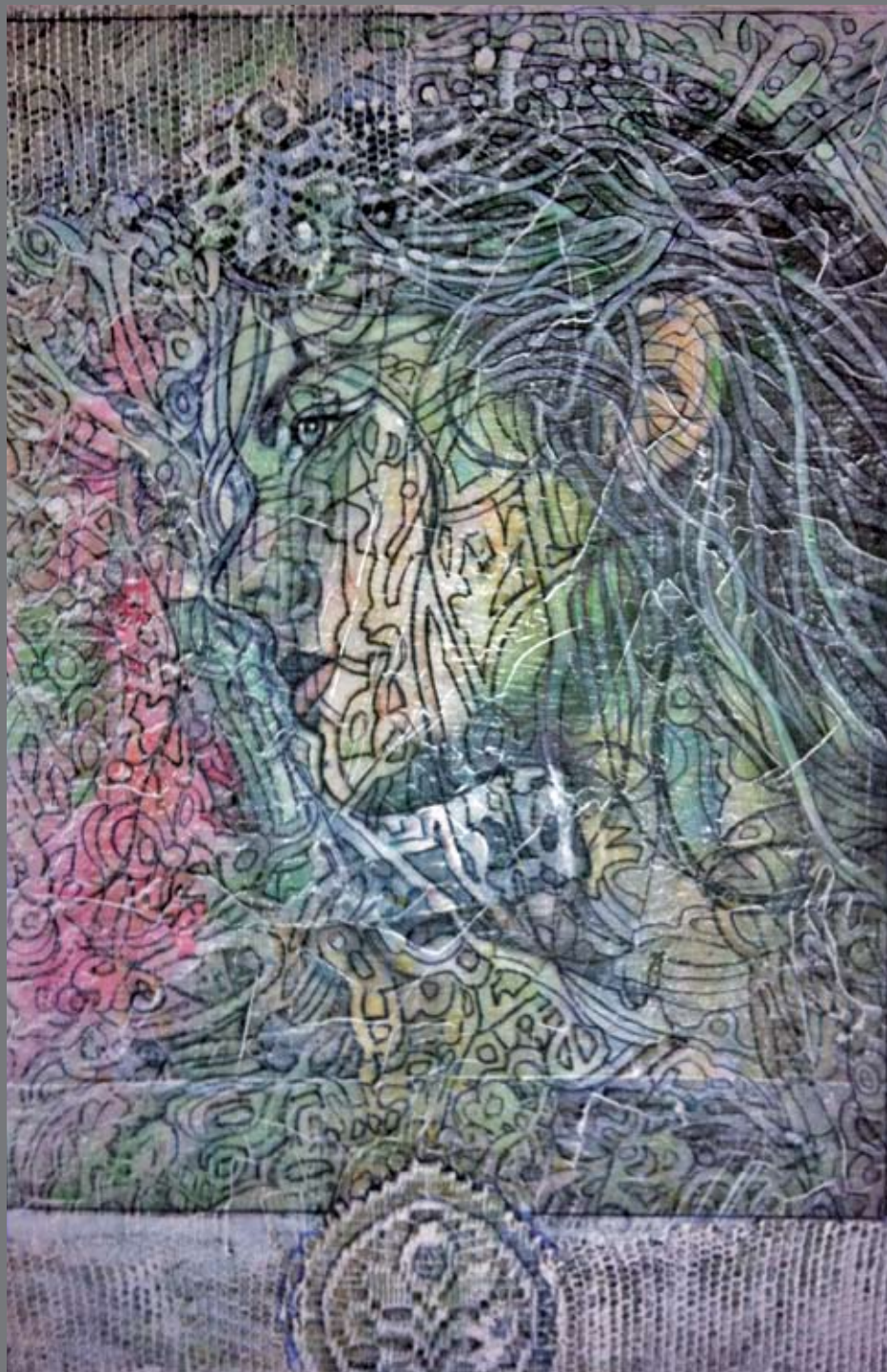
Iz ciklusa Hrvaška dekleta / Iz ciklusa Hrvatske djevojke, 75x55, akrilik, 2011