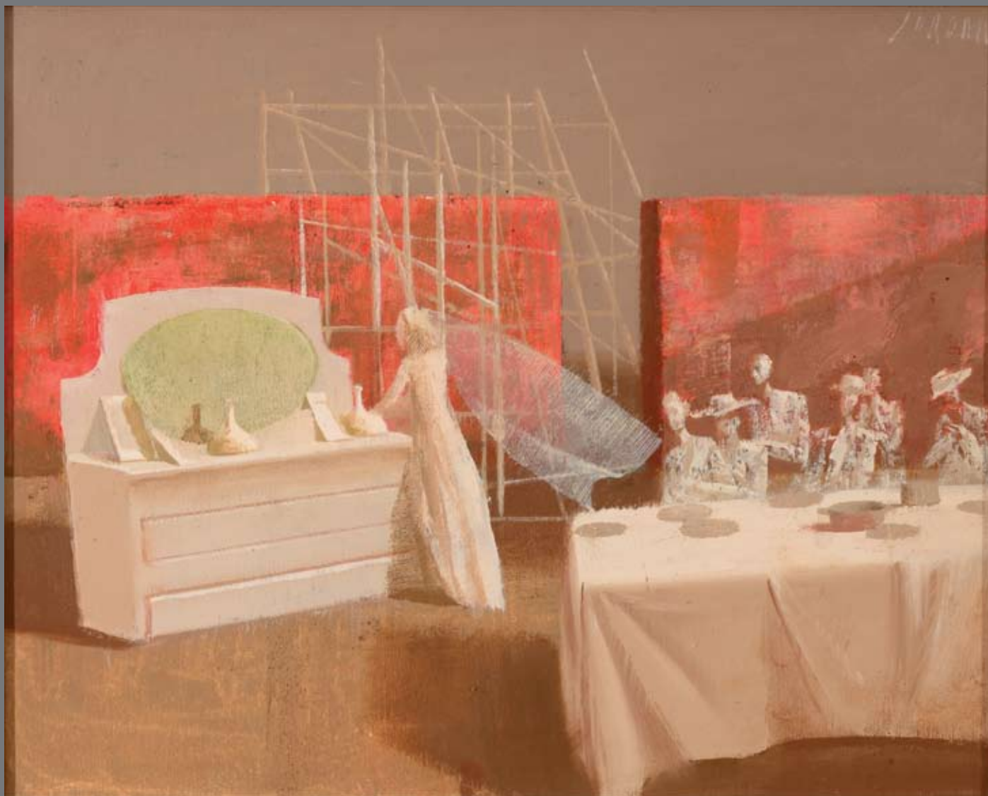
Omizje in komoda A / Sustolnici i komoda A, 40x50, olje na platnu, ulje na platnu, 2011