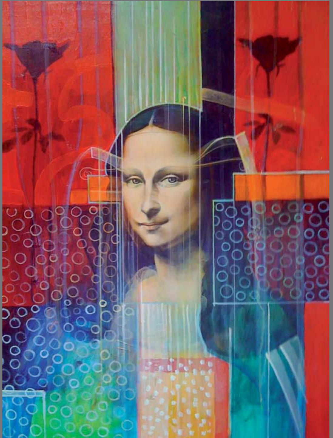
Gioconda, 150x70, akrilik, 2005