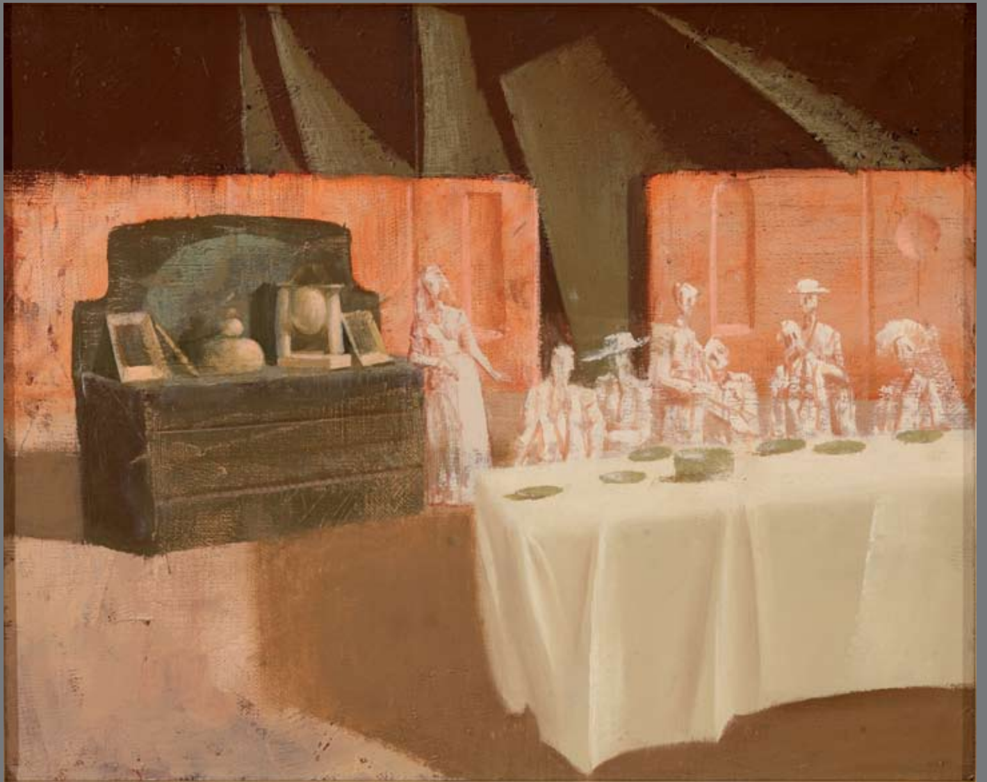
Gostija / Gozba, 40x50, olje na platnu, ulje na platnu, 2011