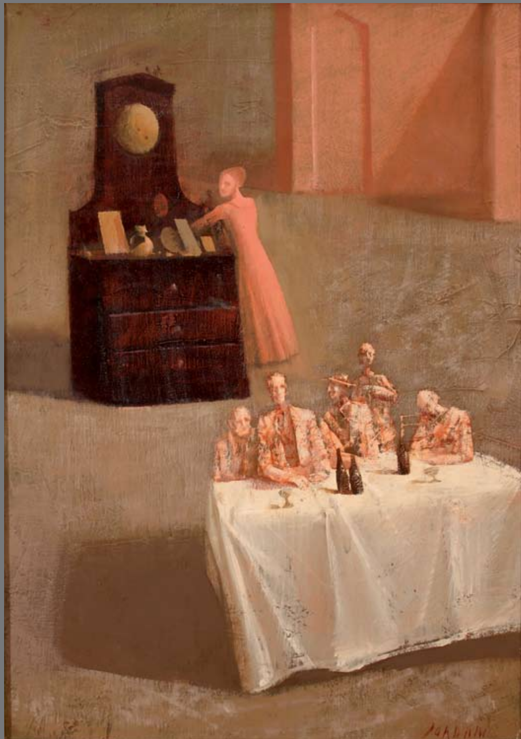
Časi / Vremena, 70x50, olje na platnu, ulje na platnu, 2011