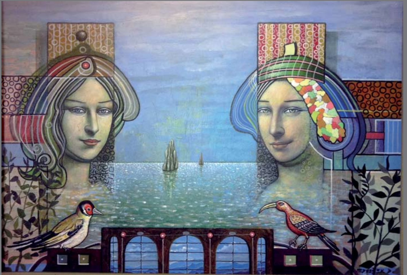
Sestre 70x50, akrilik, 2007