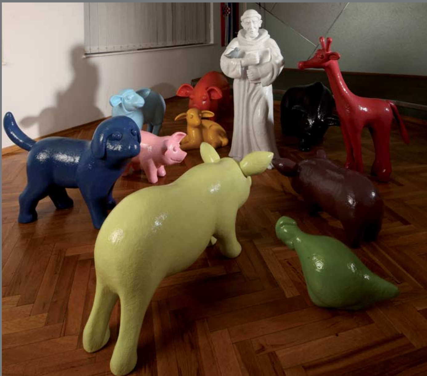
„Sveti Frančišek se pogovarja z živalmi“ „Sveti Franjo razgovara sa životinjama“ kovina / metal, pobarvani / obojeni poliester in / i kamen – oniks, 2009