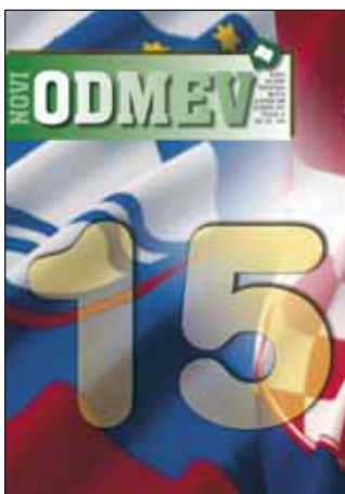
Naslovnica: 15 let delovanja Zveze slovenskih društev na Hrvaškem.